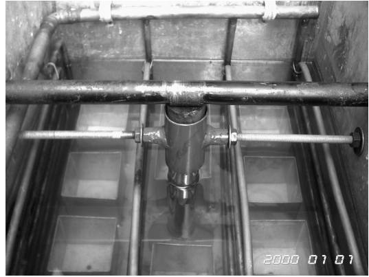
รูปที่ 2 เพลาลูกเบี้ยวที่ใช้ตะแกนเพลลาของชั้นวางขวดเบียร์

ขั้นตอนการทดลอง มีดังนี้ (1) เดินเครื่องทำความเย็นประมาณ 60 - 90 นาที เพื่อให้ได้อุณหภูมิตามต้องการ (2) นำเบียร์ลงไปแช่ในถัง (แช่ได้ครั้งละ 10 ขวด) และ (3) บันทึกค่าอุณหภูมิและความดันที่ตำแหน่ง หลังจากนั้นนำข้อมูลที่ได้ออกวิเคราะห์