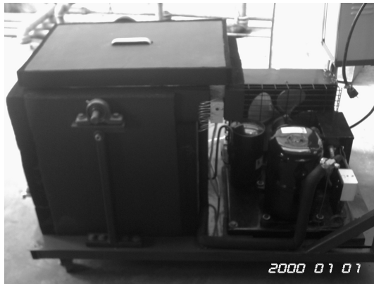
รูปที่ 1 เครื่องแช่เบียร์รุ่นที่ใช้ระบบการสั้นสะเทือน

อุปกรณ์ในการทดสอบของเครื่องแช่เบียร์รุ่นที่ใช้ระบบการสั้นสะเทือน แสดงดังรูปที่ 1 ซึ่งประกอบด้วยอุปกรณ์หลัก คือ คอมเพรสเซอร์ เครื่องควบแน่น เทอร์โมสแตติกเอกซ์แพนชันวาล์ว เครื่องระเหย มอเตอร์ขับเคลื่อนเพลาลูกเบี้ยวและเพลาลูกเบี้ยว ซึ่งในระบบใช้สารทำความเย็นผสม R-404A โดยมีหลักการทำงาน คือ เริ่มต้นเดินเครื่องคอมเพรสเซอร์ สารทำความเย็น R-404A ที่มีสภาพเป็นไอ จะถูกดูดและอัดจากคอมเพรสเซอร์ เข้าไปควบแน่นเป็นของเหลวในเครื่องควบแน่น หลังจากนั้นจะไหลผ่านเอกซ์แพนชันวาล์ว (หรือวาล์วลดความดัน) และไประเหยตัวกลายเป็นไอที่เครื่องระเหยไหลเข้าคอมเพรสเซอร์ โดยมีวัฏจักรการทำงานเช่นนี้เรื่อยไป ในขณะที่เดียวกันมอเตอร์ไฟฟ้าจะทำหน้าที่ขับเคลื่อนเพลาลูกเบี้ยวที่อยู่ด้านบนต่ออยู่กับแกนเพลลาของชั้นวางขวดเบียร์ (รูปที่ 2) มีผลทำให้ขวดเบียร์เกิดการสั้นสะเทือนเป็นช่วงๆ ทำให้โมเลกุลของเอทานอลและเบียร์ในขวดเกิดการเคลื่อนที่ถ่ายเทความร้อนออกจากขวดเบียร์ได้เร็วยิ่งขึ้น มีผลทำให้เบียร์ในขวดเป็นน้ำเร็วขึ้น