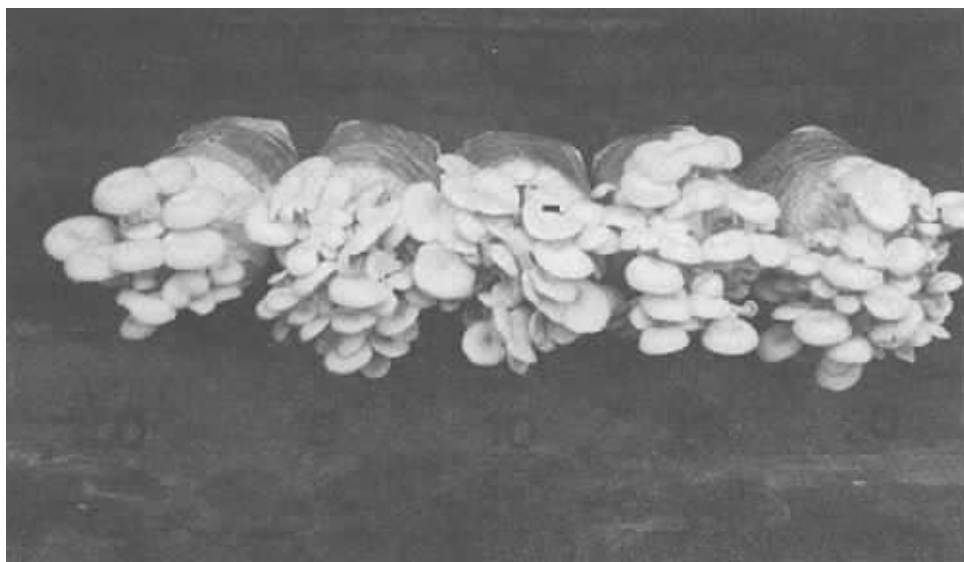
Figure 2 Fruit bodies of Pleurotus ostreatus grown on sawdust of para rubber logs supplemented by oil palm-kernel meal at different concentration (0-20%)

เห็ดนางรมสามารถเจริญเติบโตได้ดีบนใปาล์ม น้ำมัน โดยมีอัตราการเจริญเฉลี่ย 8.9 มม./วัน ในขณะที่บนขี้เลื่อยไม้ยางพารามีอัตรา 10.3 มม./วัน เมื่อนำมาเพาะในถุงพลาสติกขนาด 500 กรัม/ถุง พบว่าบนใปาล์ม น้ำมันให้ผลผลิตเห็ดนางรมจำนวน 50.0 กรัม/ถุง (B.E. = 28.6%) ส่วนบนขี้เลื่อยให้ผลผลิต 32.5 กรัม/ถุง (B.E. = 12.6%) และเมื่อนำใปาล์มผสมกับขี้เลื่อยอัตราส่วนต่างๆ กันพบว่าอัตรา 1:1 (โดยปริมาตร) เป็นอัตราส่วนที่